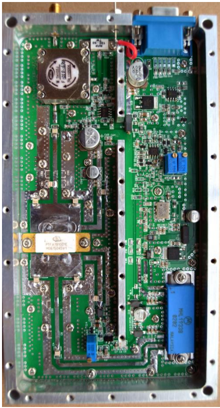
PCB 1500 MHz