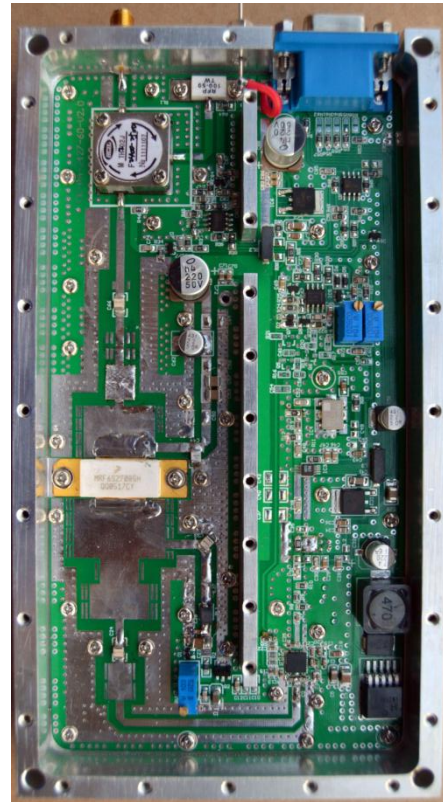
PCB 2400 MHz

Signal brouilleur: En dents de scie à facteur de forme